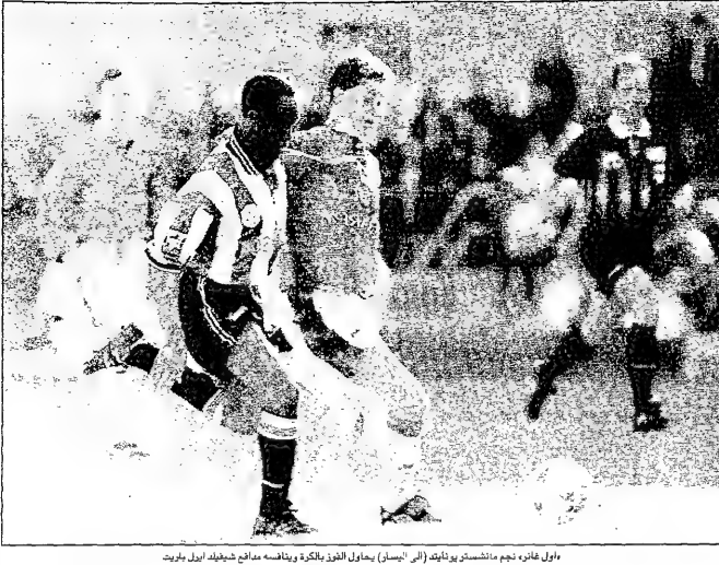
فوق غارن، نجم مانشستر يونايتد (اليمين) يحاول بالكرة وبخافه منافس حليفه ايرل بوليت